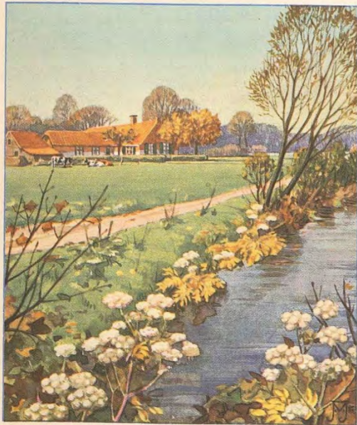
C HERFST blz. 48