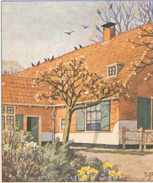
A LENTE blz. 12