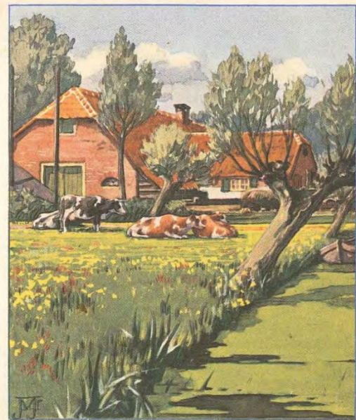
B ZOMER blz. 41