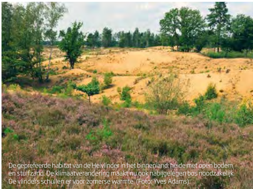
De geprefereerde habitat van de Heivlinder in het binnenland: heide met open bodem en stuifzand. De klimaatverandering maakt nu ook nabijgelegen bos noodzakelijk. De vlinders schuilen er voor zomerse warmte.

Voor de auteurs van het boek Natuurbeheer is het zonnklaar: klimaatverandering zal de komende decennia een leidend thema zijn in het beheer van natuurgebieden. Volgens het Belgische KMI zal de gemiddelde temperatuur in België deze eeuw namelijk met gemak 5° C stijgen. Maar wat is volgens de auteurs het startpunt van dat beheer? Niet meteen hakken, graven, zaaien of introduceren, zo staat in “klimaatadaptatie en natuurbeheer”, een van de nieuwe hoofdstukken in een derde editie van het Vlaamse standaardwerk Natuurbeheer . Eerst kijken hoe de natuur reageert op het veranderende klimaat. Tezamen met nieuwe hoofdstukken over onder andere “rewilding”, is klimaat een thema waarmee een klassieker van ruim dertig jaar oud actueel is gemaakt. Toch is klimaatverandering zeker niet het grootste probleem waar aardbewoners mee kampen, vinden de auteurs. In een verhelderende taart met tien punten kleurt de punt van biodiversiteitsverlies het diepst rood. Pas na een tweede dieprode taartpunt, die van de stikstofcrisis, haalt de klimaatcrisis nog maar nét de derde